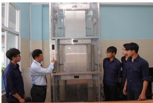
Giáo viên hướng dẫn học sinh vận hành hệ thống thang máy

Kỹ thuật viên, bảo trì, sửa chữa xe nâng, ở các nhà máy, xí nghiệp, các công ty kinh doanh; nhân viên kinh doanh về bảo trì và sửa chữa máy xây dựng và máy nâng chuyên.